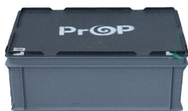
KIT IZI PARTY 60 x 40 x 29 cm

La grande caisse contient : 300 pièces ECO-12, 480 pièces ECO-30, 240 pièces ECO-60, 100 pièces Champagne Deluxe et 150 pièces Vin Deluxe.