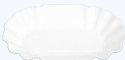
BARQUETTE A FRITES