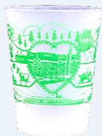
Gobelet ECO-12 Aussi disponible en noir et blanc