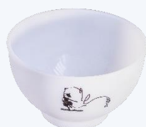
BOL A SOUPE Aussi disponible en bleu