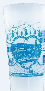
Gobelet ECO-60 Aussi disponible en bleu foncé, rose, rouge et violet