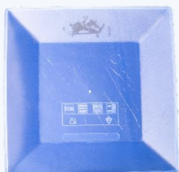
ASSIETTE PLATE 19 x 19 Aussi disponible en blanc