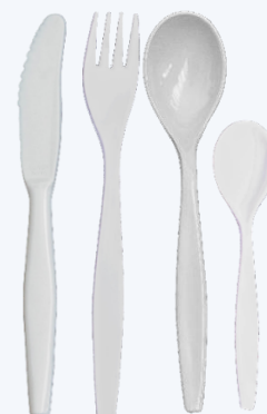
COUVERTS Loués à l'unité et séparément