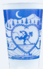
Gobelet ECO-30 Aussi disponible en bleu clair, noir et violet